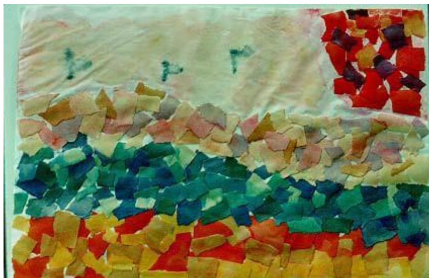
圖 4：用撕紙和黏貼制作的圖片