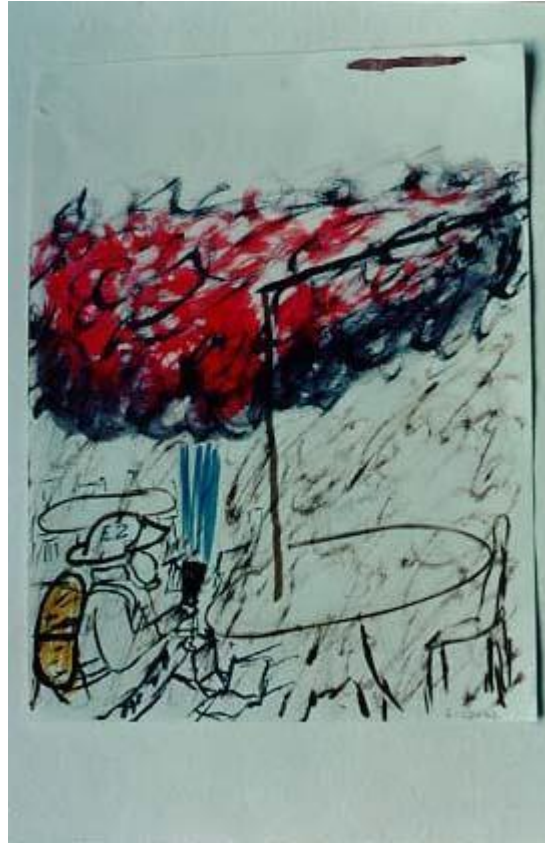
圖 3：幻想王國中的有用角色