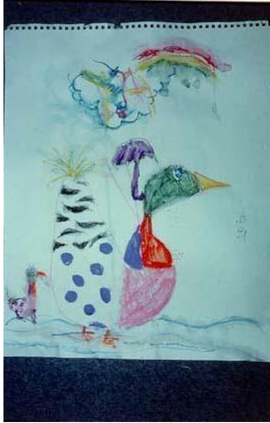
圖 2：「很久很久以前童話故事」繪畫

畫不一定是兒童對災難實際感受的反映，它只是通過幻想提供了一個講出他/她所擔憂的安全方法。隨著這個幻想出來的王國被創造，你可以建議一些對處於災難的幻想王國有幫助的角色，如醫生或護士、警察或家長，甚至是特別有幫助的幻想角色（見圖 3）。另一個建設性的方法是將彩色的紙或雜誌頁撕成小碎片，再黏貼拼成圖樣（見圖 4）。簡單的形狀如圓形、三角形。你也可以使用培樂多彩泥(Play Doh 2 )或紙殼模型（paper mache 3 ）製作一個守衛精靈或護衛人物的 3 維雕塑（見圖 5）。