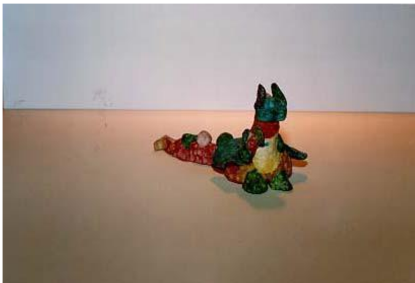
圖 5：守衛精靈或護衛人物的 3 維雕塑

製作紙殼模型雕塑時可以用氣球作為軀幹的模子。將氣球吹脹並綁緊，把報紙條沾上膠水貼在氣球上，這樣就做好了基本的軀幹，待模型完全乾透就可以將氣球戳破。可以將小塊的紙巾或報紙沾滿膠水進行疊加，打造這個模型的外型、服飾（比如翅膀、斗篷和其他的細節）、臉部、手和爪子。做這個活動，手和桌子都會弄得髒兮兮的，所以需要報紙提前蓋好桌子，也可以讓你的孩子穿個罩衫。